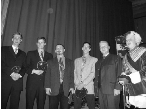
Philistrierung - Gruppenbild

Weitere Höhepunkte waren die Philistrierung von 4