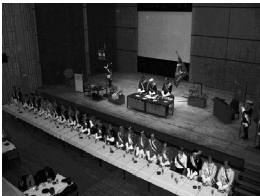
Blick von oben auf das Präsidium

160 Semester Leben der 4 Prinzipien, an ihnen Festhalten, was auch immer kommen möge.